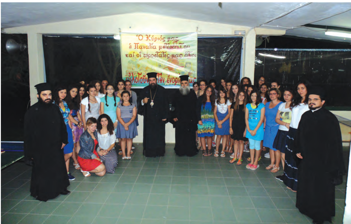
Άπό τήν επίσκεψη τοῦ Σεβασμιωτάτου στίς κατασκηνώσεις Ἁγ. Δημητρίου (Χριστοῦ Πηγῆ) (17/7).