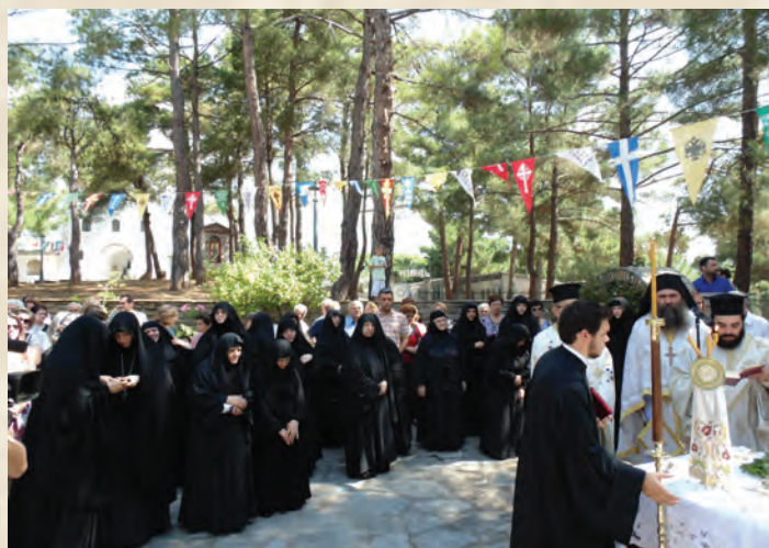
Ἁγιασμός στόν αὐλίο χοῦρο τῆς Ἱερᾶς Μονῆς.

ραιτούμεθα, ἀλλά συνεχίζουμε. Αὐτοί πού ἦσαν οἱ θεμελιωταί, αὐτοί ἐξακολουθοῦν καί νά στηρίζουν καί νά συντηροῦν καί νά προωθοῦν τό δικό τους ἔργο. Κι ἐνῶ ἡ ἔλλειψις τῆς σωματικῆς παρουσίας προκαλεῖ ἕνα βαθύ βουβό πένθος, ὥστόσο ὁ σοφός Σολομών βεβαιοῖ: «Δίκαιοι εἰς τόν αἰῶνα ζῶσιν», ἐπισφραγίζον-