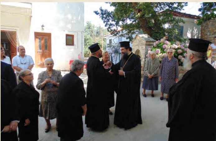
Άπό τήν έπίσκεψη τοϋ Σεβασμιότατου Ποιμενάχου μας στήν Πορταριά (3/8).