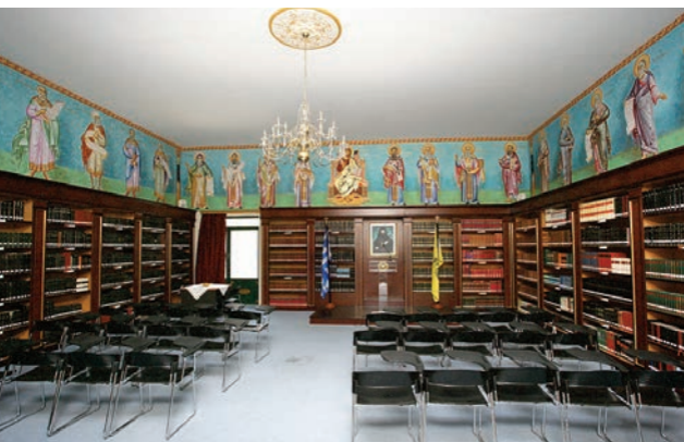
Ἡ «Μυριόβιβλος» Βιβλιοθήκη τῆς Ἱερᾶς Μητροπόλεως Σερρῶν καί Νιγρίτης.