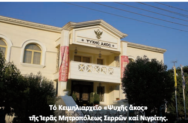
Τό Κειμηλιαρχεῖο «Ψυχῆς ἄκος» τῆς Ἱερᾶς Μητροπόλεως Σερρῶν καί Νιγρίτης.