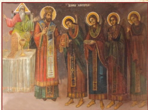
Ἡ θεία Λειτουργία. Καθολικό Ἱερᾶς Μονῆς «Παναγίας Βοηθείας» Χίου.

κτά μυστήρια τοῦ Χριστοῦ ἐπιτελοῦνται, ἐνῶ ἡ Τράπεζα εἶναι ἀκόμη στρωμένη, τά παρατᾶς ὅλα στήν μέση καί φεύγεις; Καί μπορεῖς νά συγχωρεθεῖς; Ποιά ἀπολογία θά βρεῖς; Θέλετε νά σᾶς πῶ ποιοανοῦ ἔργο ἐπιτελοῦν ἐκεῖνοι πού φεύγουν πρὶν τελειώσει ἡ Θεία Λειτουργία καί δέν προσφέρουν τίς εὐχαριστήριες ὠδές στό τέλος τῆς τραπέζης; Εἶναι λίγο βαρὺ αὐτό πού θά σᾶς πῶ, ἀλλ' ὅμως καί πολύ ἀναγκαῖο γιά τήν ραθυμία τῶν πολλῶν. Ὅταν κοινώνησε στό